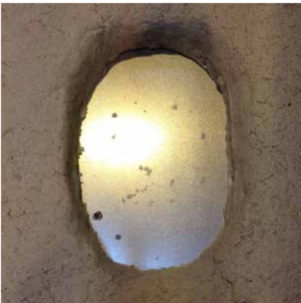
3 - Déposer le flocage selon les dimensions de la trappe