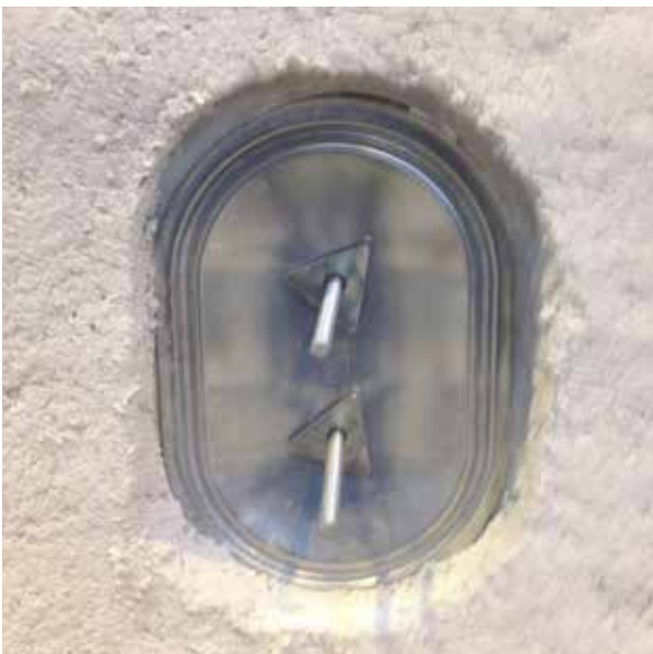
5 - Poser la trappe de visite