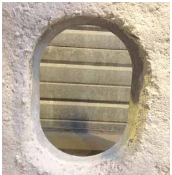
4 - Découper la tôle de la gaine en utilisant le gabarit autocollant