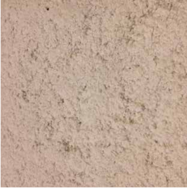
1 - Gaine en tôle floquée