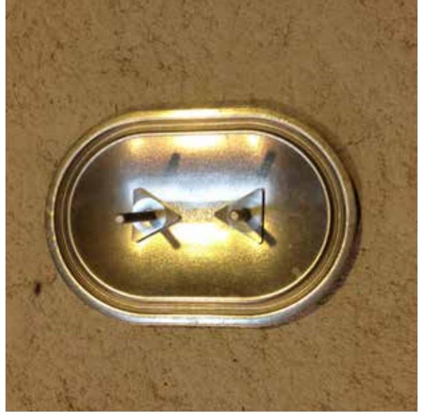
2 - Utiliser la trappe comme gabarit